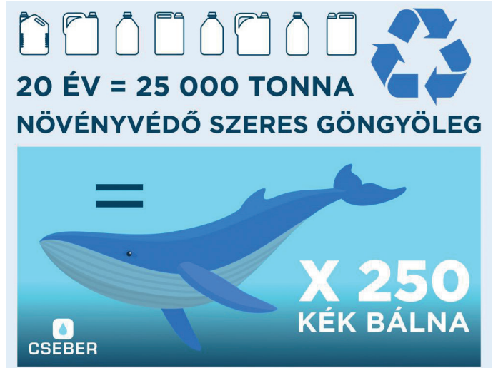
A CSEBER gyűjtőhelyek az elmúlt húsz évben 25 000 tonna növényvédő szeres göngyöleget gyűjtöttek össze

Az elmúlt 20 évben összesen 25 000 tonna növényvédő szerrel szennyezett göngyöleget adtak le a gazdálkodók a CSEBER gyűjtőhelyeken. Profesionális hulladékgazdálkodási partnerek közreműködésével országszerte kamionok ezrei szállították el ezeket a hulladékkezelőkhöz és a végpontokra.